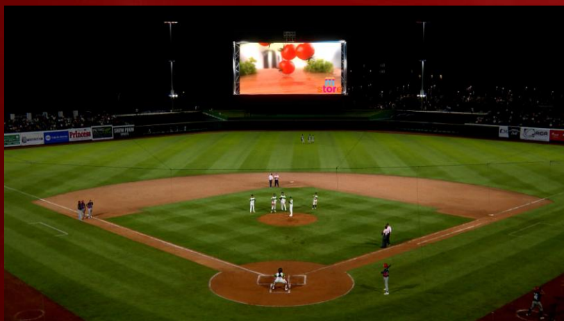
MENCIÓN + VIRTUAL INTERACTIVA https://youtu.be/UEuUCIzcS_0 DESDE EL ESTADIO