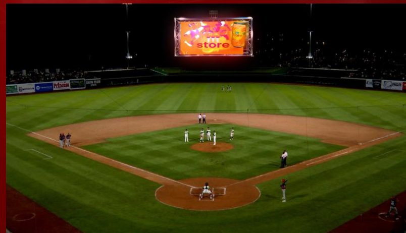
VIRTUAL 3D DESDE EL ESTADIO https://youtu.be/ZHkwwhIbXrs