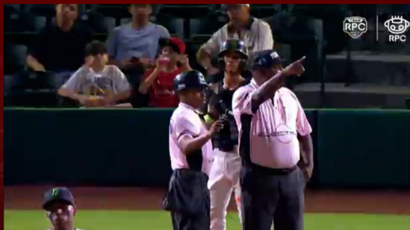
MENCIÓN EN TRANSMISIÓN DE PARTIDO https://youtu.be/35ECHPeD_QM